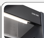
Luce interna LED